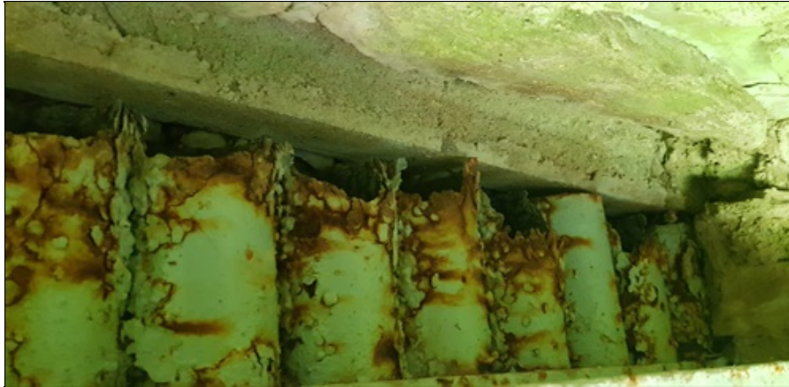
výmětové trubky jsou už zcela zkorodované