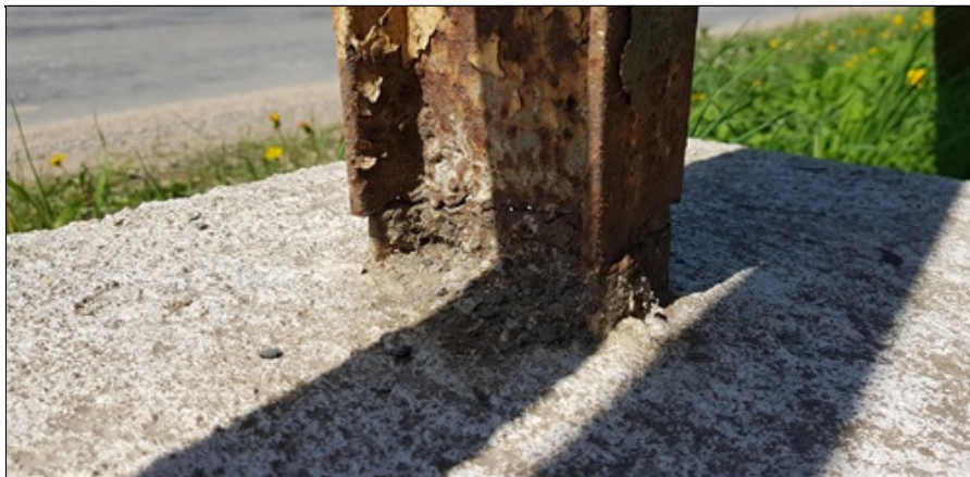
kotvení zábradlí !!!