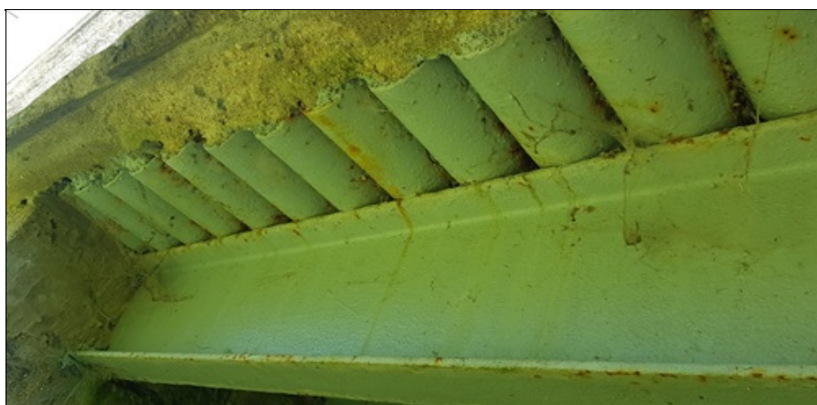
konstrukce v rozšíření