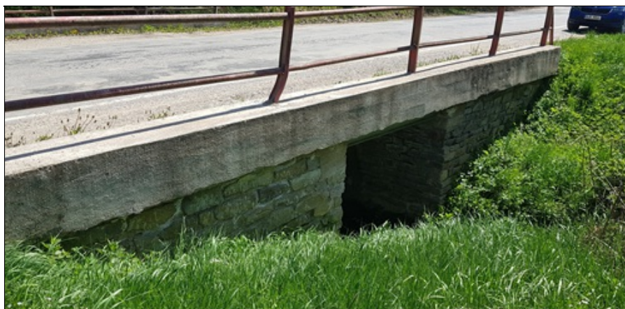
levá římsa a deformace zábradlí