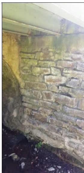
kamenné opěry v rozšíření