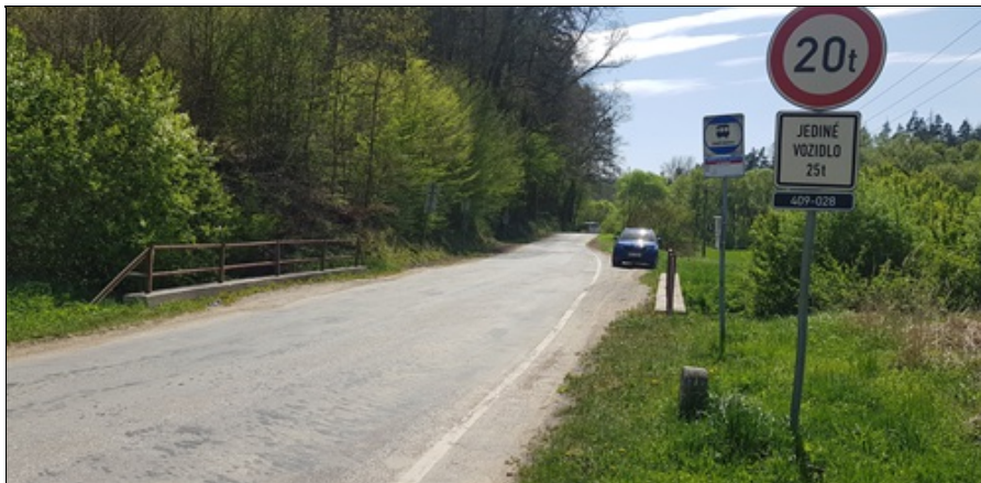
pohled proti staničení