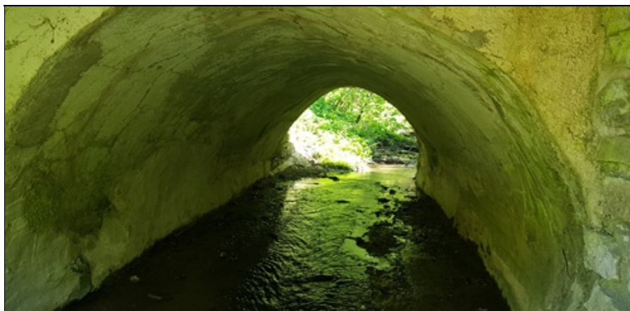
NK původní části - omítnutá cihelná klenba