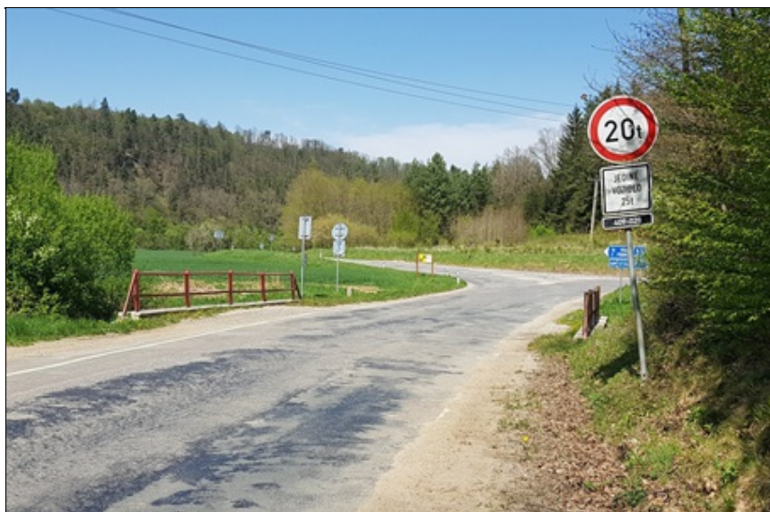
pohled ve směru staničení