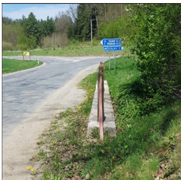
pravá římsa a stav krajnice