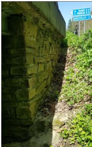
svah u pravého křídla u Op2